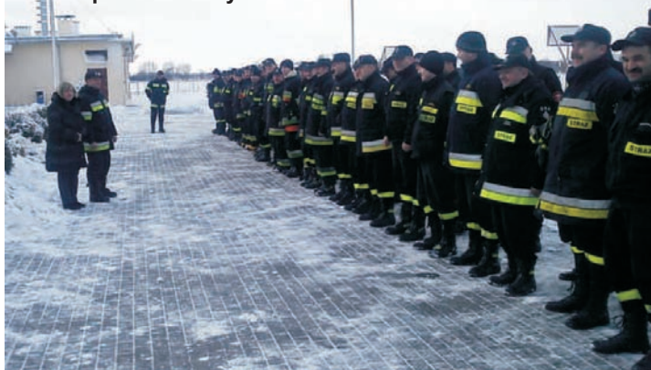
Podsumowanie zagrożenia powodziowego