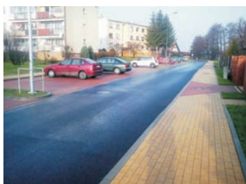
Remont drogi ul. Rubinowa w Gronowie Górnym

Dotacje udzielone z budżetu gminy w 2015 r. objęły kwotę 1.892.892 zł, m.in.: dla biblioteki gminnej na bieżącą działalność 199.280 zł, dla osób fizycznych na budowę przydomowych oczyszczalni ścieków 32.098 zł, dla samorządu Miasta Elbląg tytułem pokrycia kosztów uczęszczania dzieci z terenu gminy Elbląg do przedszkoli 324.728 zł, dla TPD na prowadzenie punktów przedszkolnych przy gminnych szkołach podstawowych 225.399 zł, dopłaty do komunikacji miejskiej 296.187 zł, dopłaty do ceny wody 292.301 zł, dopłaty do ceny ścieków 93.308 zł, dopłaty do odpadów stałych 429.591 zł (o taką kwotę nie zamknął się system gospodarki odpadami). Największy udział procentowy w wykonanych wydatkach ogółem miały: oświata i wychowanie 32,90 %, pomoc społeczna 20,51 %, transport i łączność 16,41%, administracja publiczna 12,52%. W 2015 roku zanotowano wzrost środków finansowych przeznaczonych z budżetu Gminy na dotacje dla organizacji pozarządowych o 37% względem roku 2014. Na realizację zadań publicznych ogółem w 2015 r. udzielono dotacji na kwotę 70.350 zł. W trybie pozakonkursowym w ramach tzw. małych grantów nasze stowarzyszenia zrealizowały 23 zadania dla mieszkańców w formie imprez kulturalno-sportowo-edukacyjnych. Jedną z największych imprez kulturalnych w gminie zrealizowaną w ramach ogłoszonego konkursu w 2015 roku były jubileuszowe XX Dożynki Gminne, które odbyły się w Wężynie. Honory Starostów Dożynkowych pełnili Państwo Danuta i Adam Matusiak.