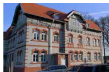
Termomodernizacja budynku gminnego przy ul. Żeromskiego 2B w Elblągu