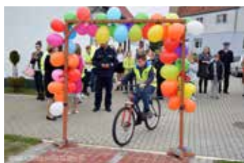
Miasteczko Ruchu Drogowego