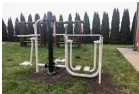
Siłownia plenerowa w Nowakowie