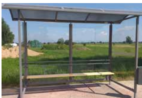
Wiata przystankowa w Adamowie