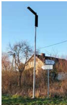
Lampy uliczne Nowotki

Ze środków funduszu sołeckiego w Gminie Elbląg zrealizowano między innymi: