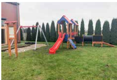
Plac zabaw w Nowakowie