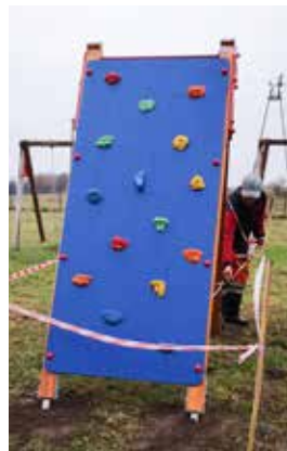
Ścianka wspinaczkowa Przechmark Osiedle