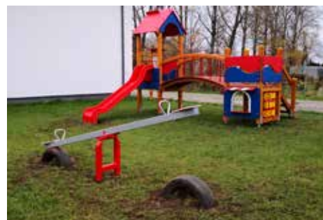
Plac zabaw - Lisów