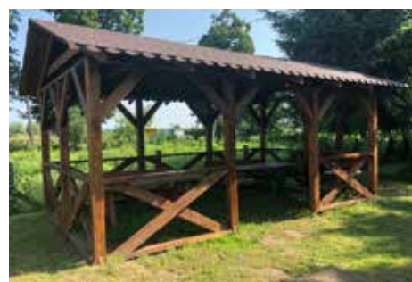
Wiata - Nowy Dwór