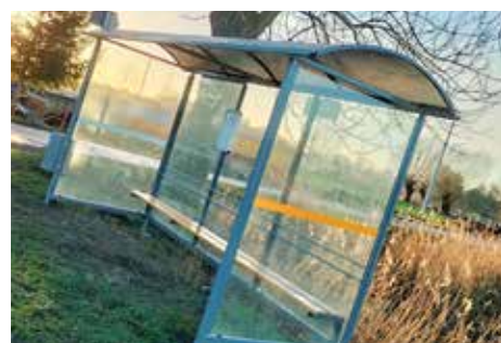
Wiata przystankowa w Nowotkach