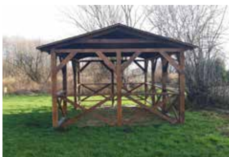
Wiata w Kępie Rybackiej