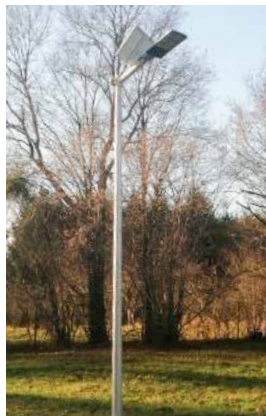
Lampy uliczne Przechmark