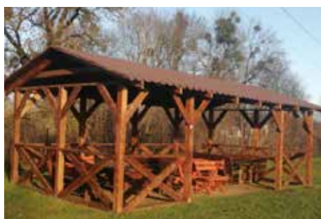
Wiata w Przechmarku