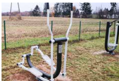
Siłownia plenerowa - Przechmark Osiedle