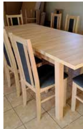
Wyposażenie świetlicy Raczki Elbląskie