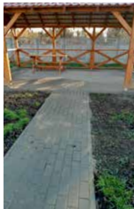
Polbruk Raczki Elbląskie