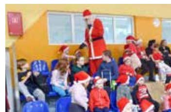
Gminny Turniej Mikołajkowy