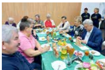
Spotkanie Wójta z Seniorami