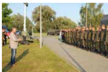
Ćwiczenia na Wyspie Nowakowskiej