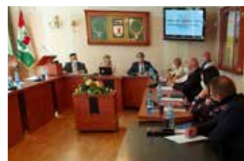
Wotum zaufania i absolutorium dla Wójta Gminy Elbląg